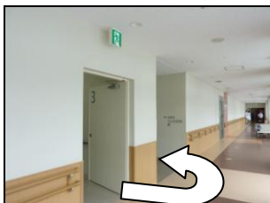
階段の先で左に折れる