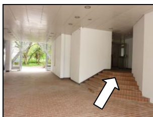
この入口より入り、エレベーターで9階まで上る。