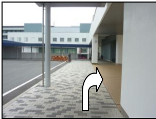
病院に入らず、右に曲がる