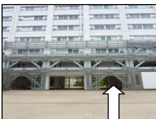
研究棟（表側）右手入口

研究棟（表側）の右手入口から入る場合です。こちらからエレベーターで9階まで上ってください。健康社会医学講座はエレベーターを出てすぐ右手となります。 940室（医局） へお越してください。