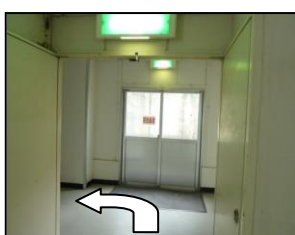
突き当たりで左折