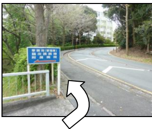
橋を渡りきり、左へ曲がる

橋を渡りきったところで、左に曲がり、ゆるやかな坂を上ります。左手の看護学科棟を通り越し左に曲がり、研究棟（表側）に進みます。建物の左右に入口がありますが、左手から入った場合をご案内します。