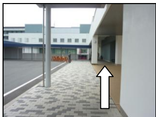
バスのりばから2階通用口へ進む