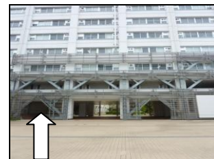
研究棟（表側）左手入口

左手入口より研究棟に入り、左、左と曲がります。エレベーターで9階まで上ってください。健康社会医学講座は9階フロアの西側（エレベーターを出て右手）となります。