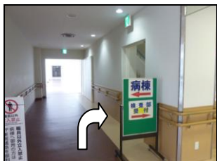
検査部受付向こうの階段を上る

階段を上り切り、左に折れてすぐにある入口から入ります。「 たんぽぽ学級 」の前を通り過ぎ、長い渡り廊下に入ります。