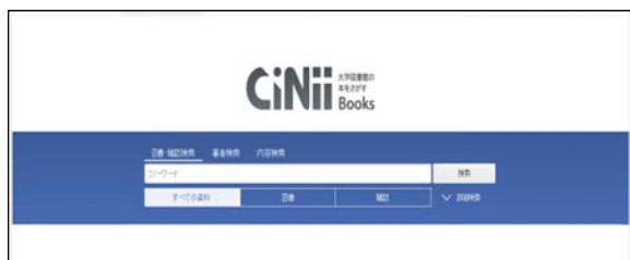
*大学図書館の本をさがす