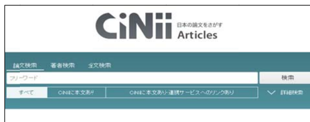
*日本の論文をさがす