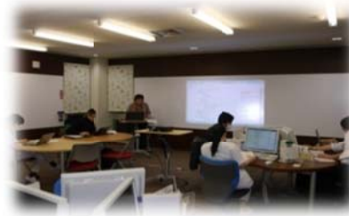
(ラーニングコモンズでの講習会)