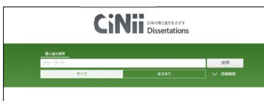
*日本の博士論文をさがす

国立情報学研究所は 10 月から従来の国内論文検索や図書の所蔵検索に加え、日本の博士論文検索を行うことのできる CiNiiDissertations のサービスをはじめました。下記は各検索機能画面です。アクセスはこちらから http://ci.nii.ac.jp/d/