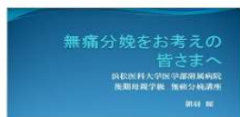
当院で無痛分娩を希望される皆様へ