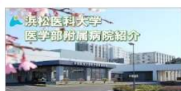
浜松医科大学医学部附属病院紹介動画