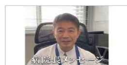
松山病院長メッセージ