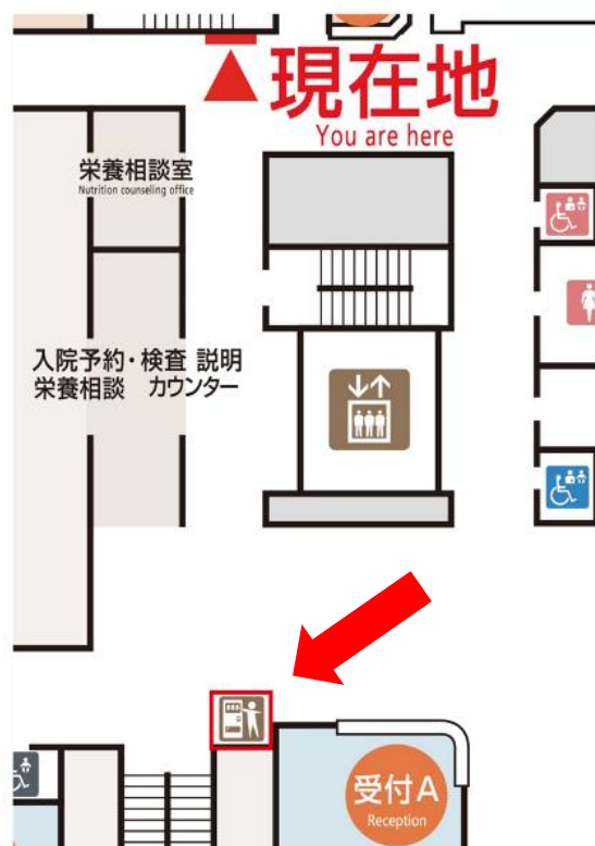
例：外来棟 2 階のフロアマップ