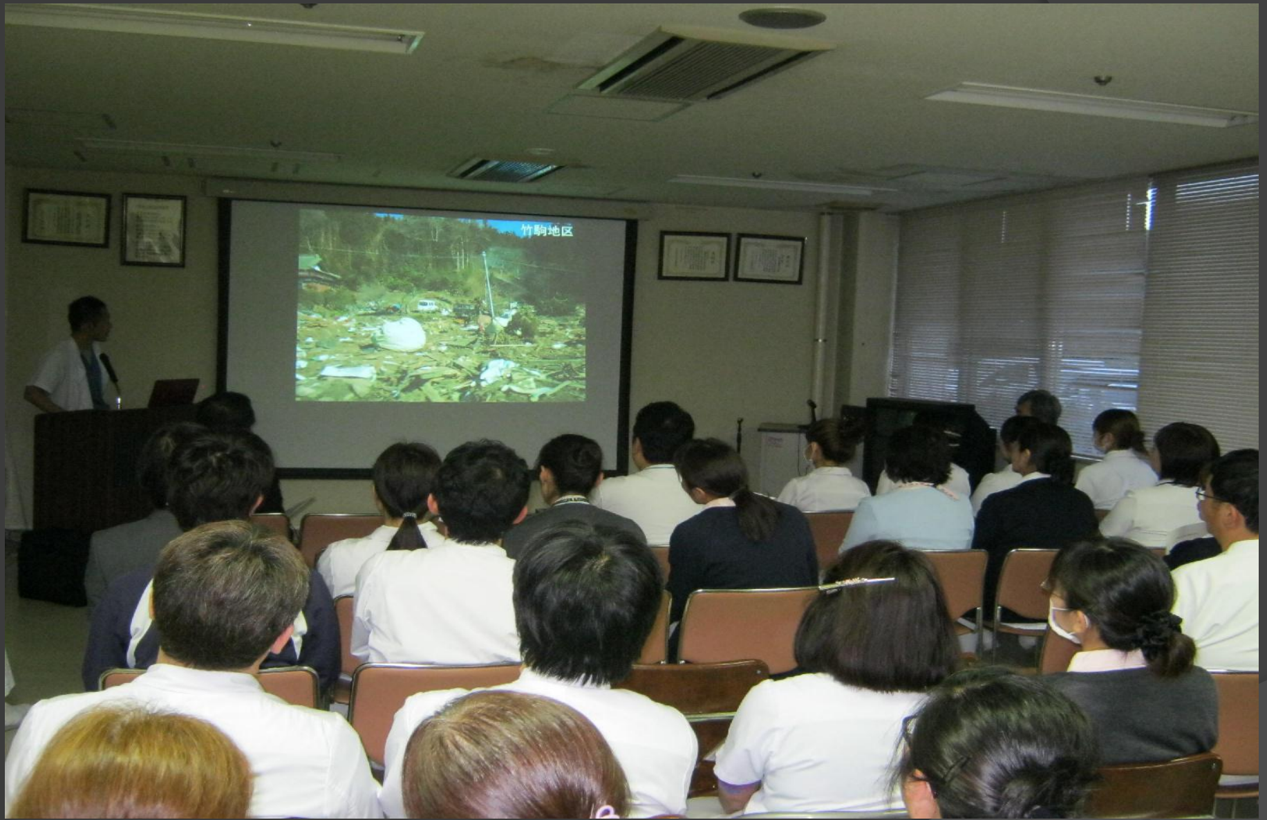
第4回災害対策委員会 (災害拠点病院としての在り方検討会)