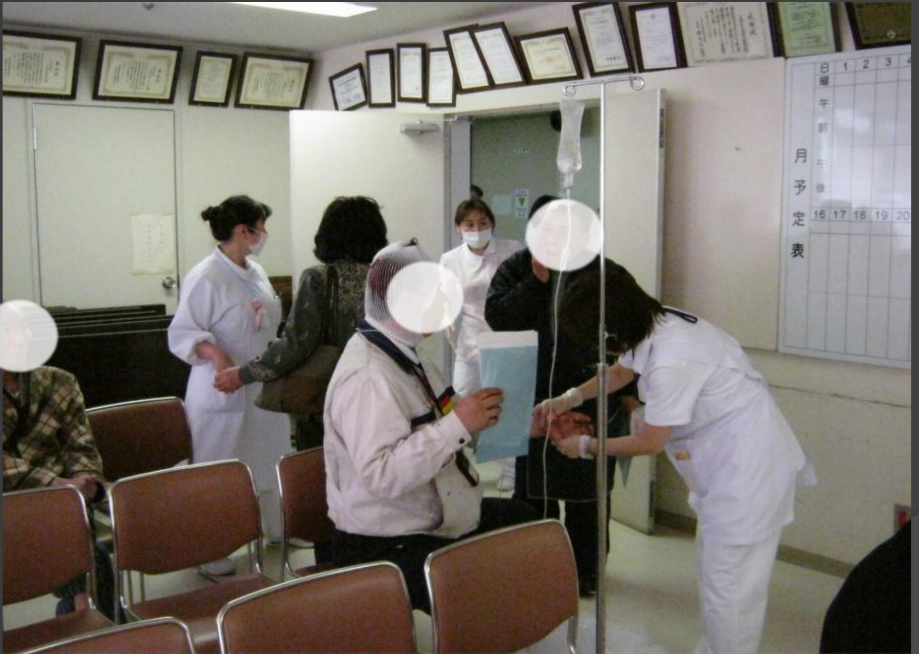
救急患者を多目的ホールで処置