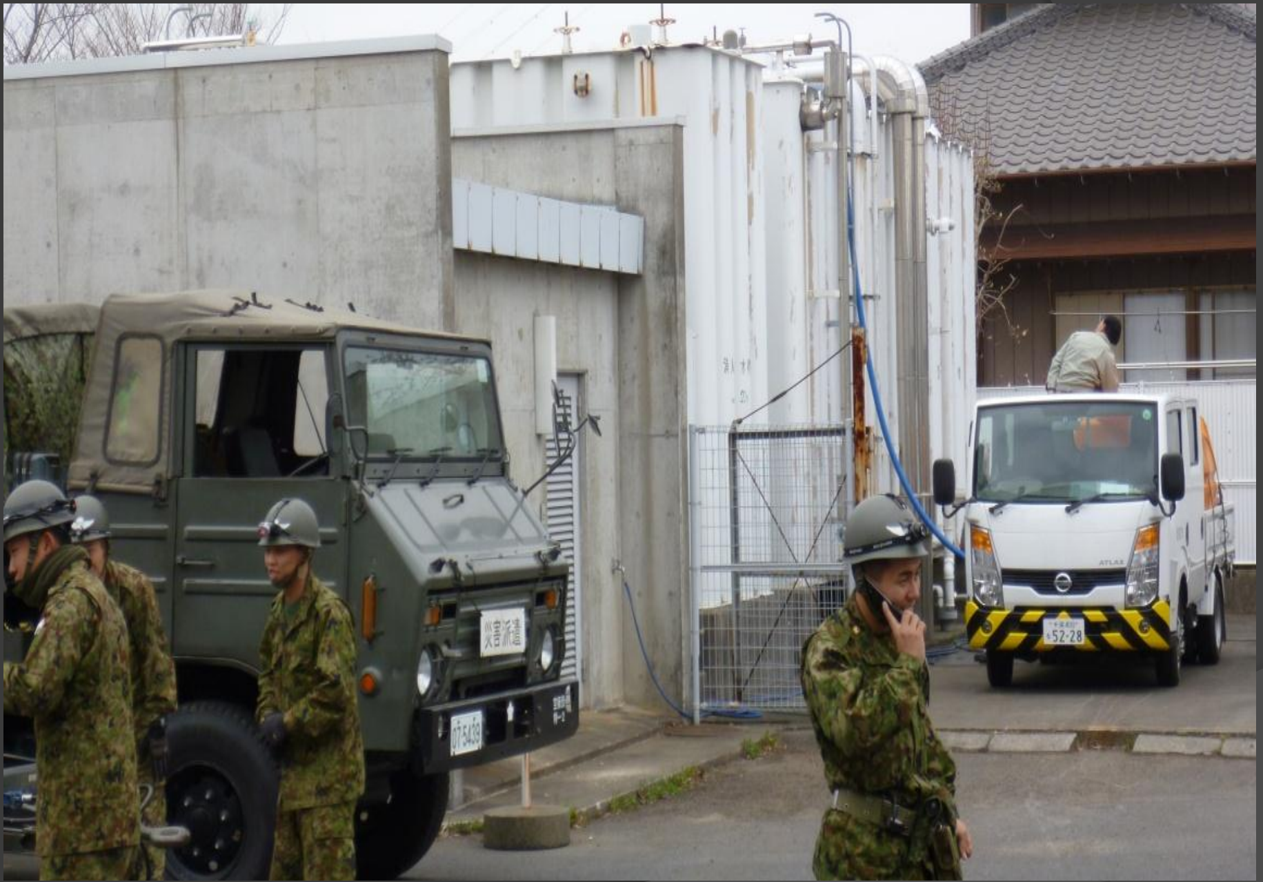
自衛隊等による給水作業