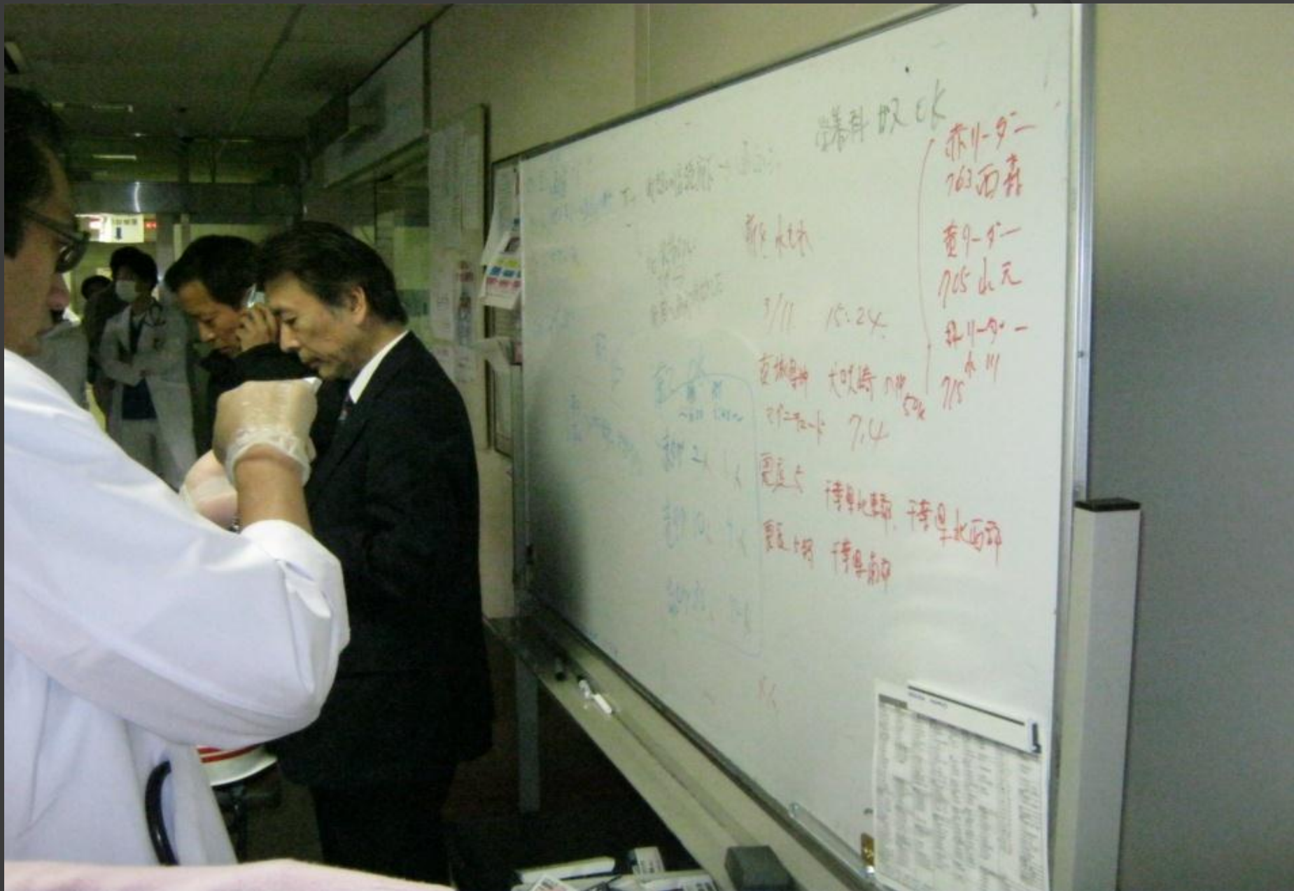
救急室前に災害対策本部の立ち上げ