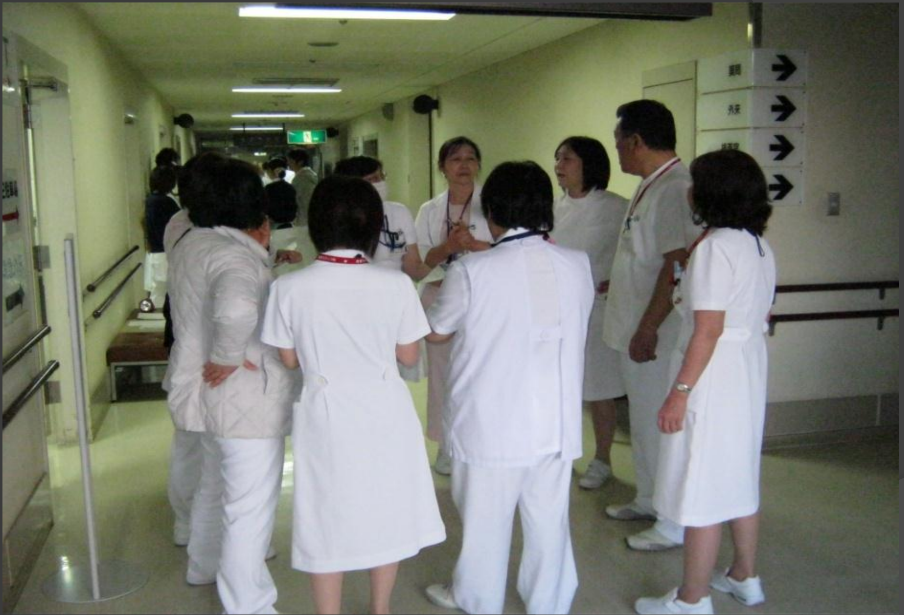
各部門に分けて通常業務に戻すための打合せ