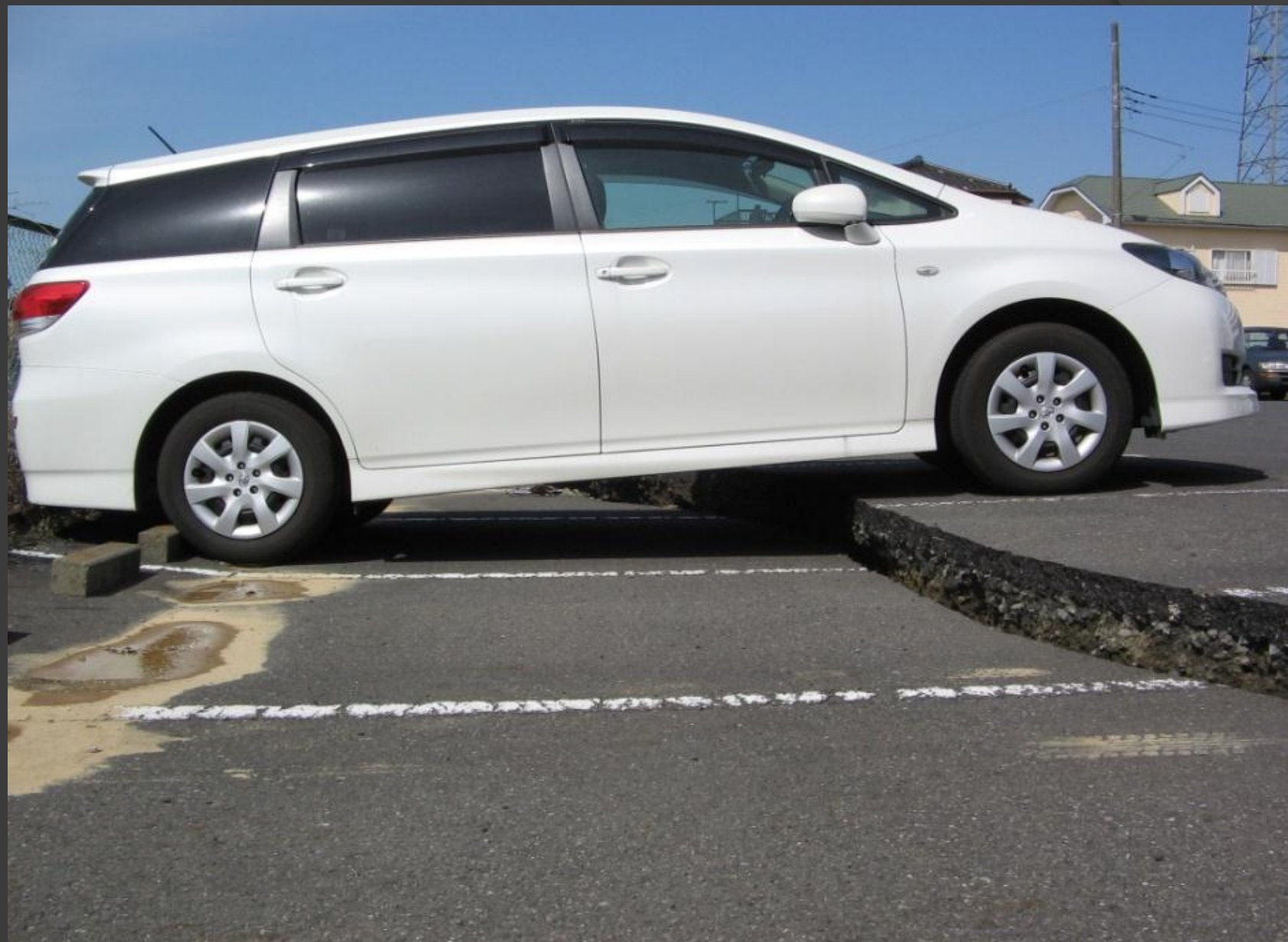
液状化により駐車場の陥没