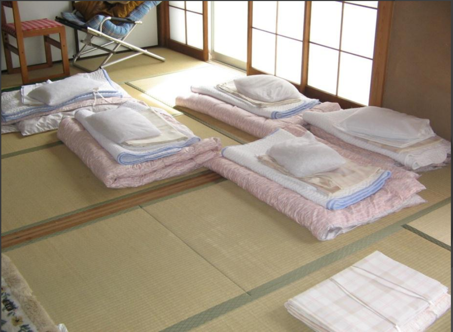
職員の夜間待機と仮眠場所