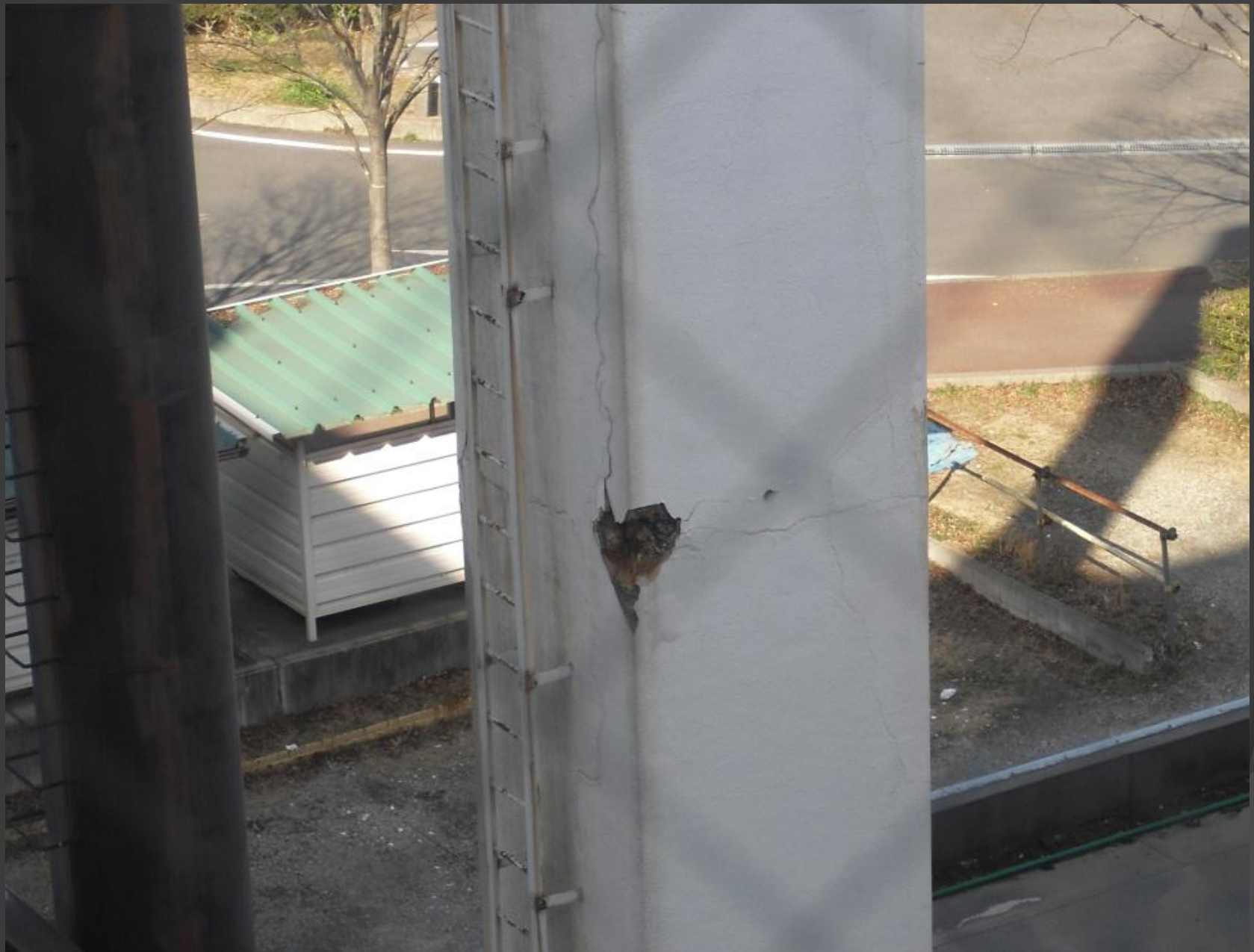
15m煙突の破損とクラック