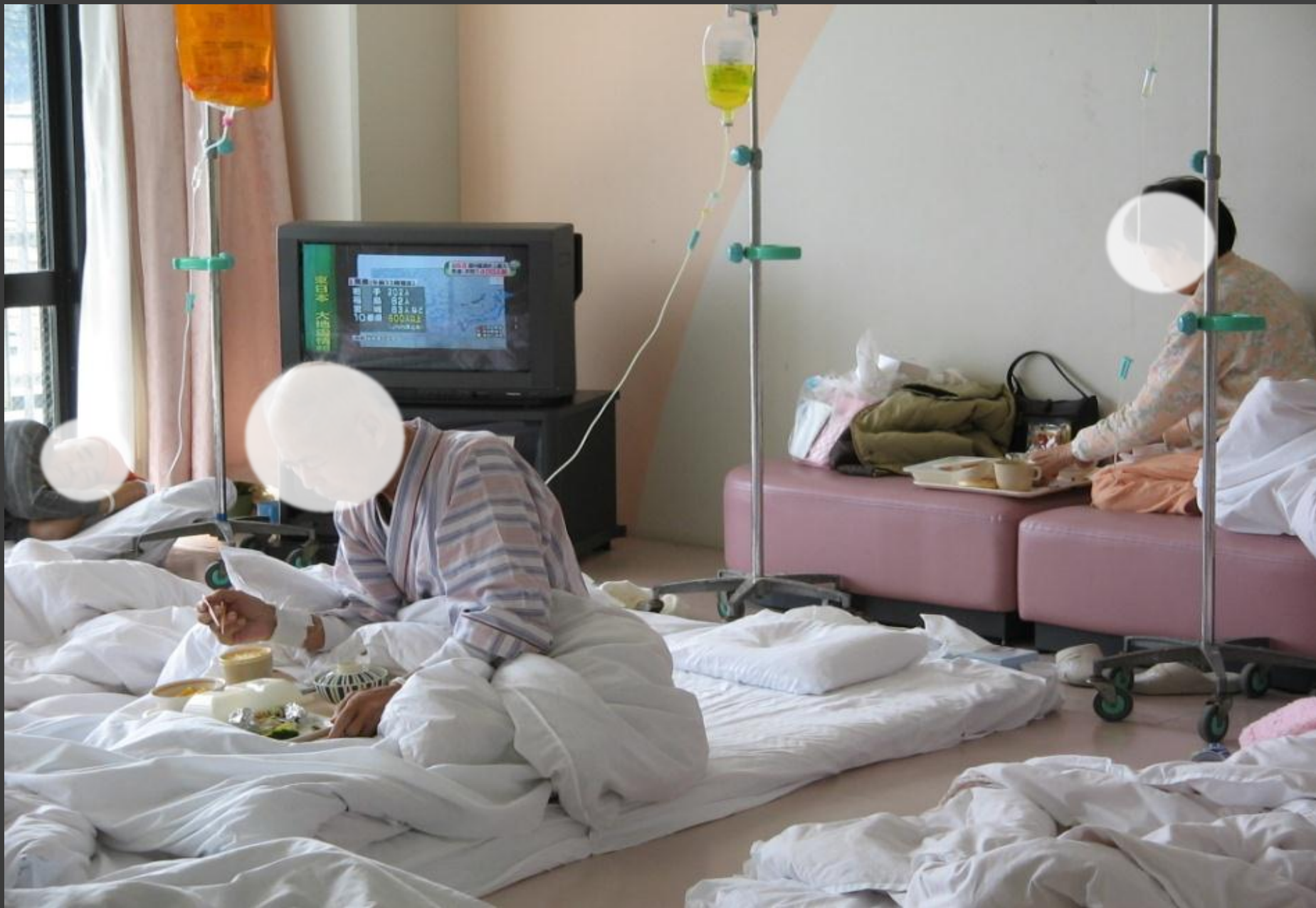
本館入院患者一時避難