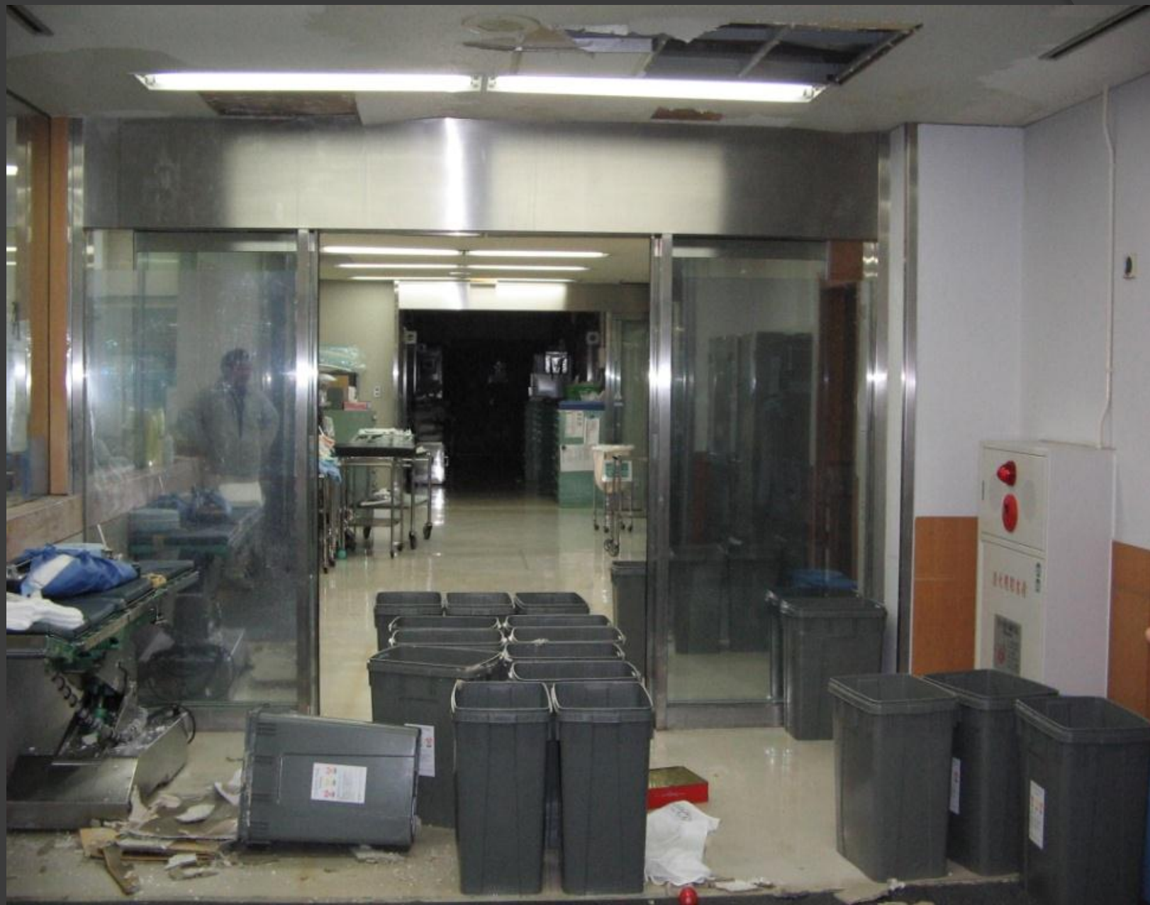
水道管の破断により漏水