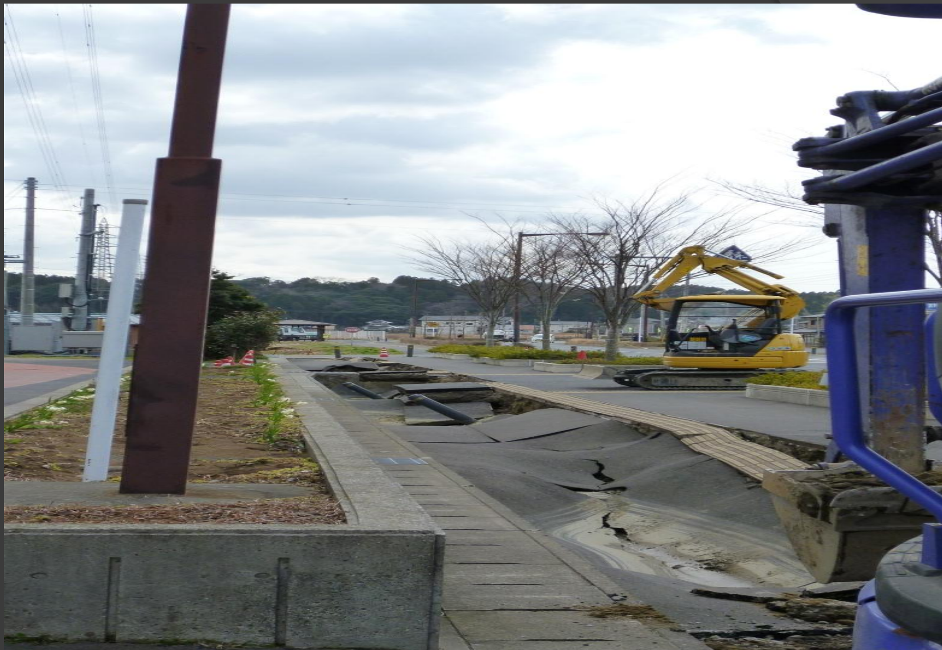
液状化により歩道の陥没