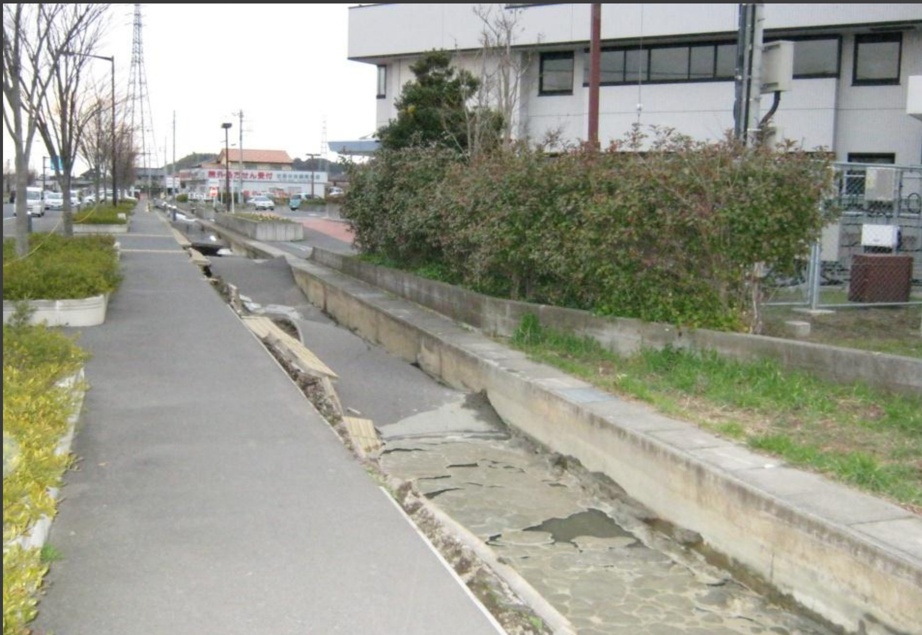
液状化により病院の出入り口が陥没