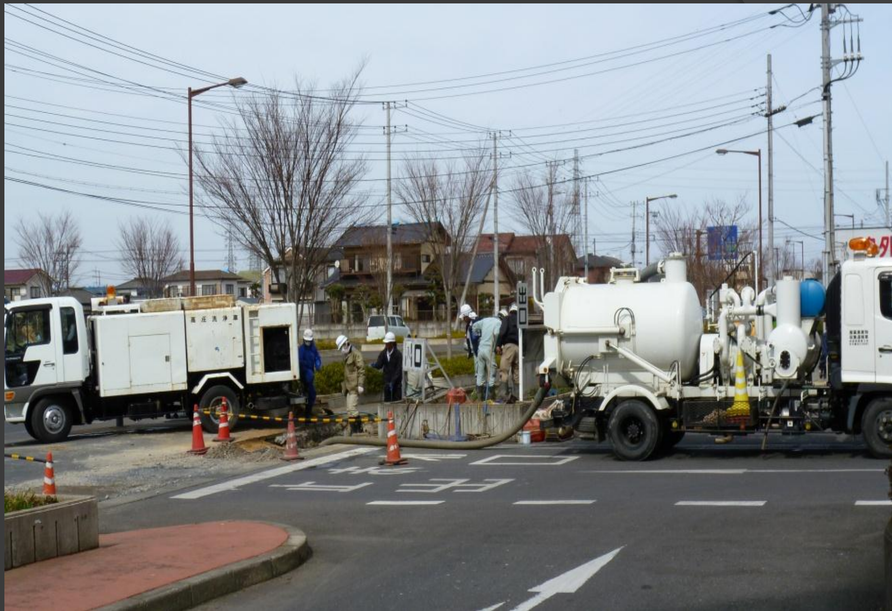
バキュームカーによる下水汲みとり(一日約15回)