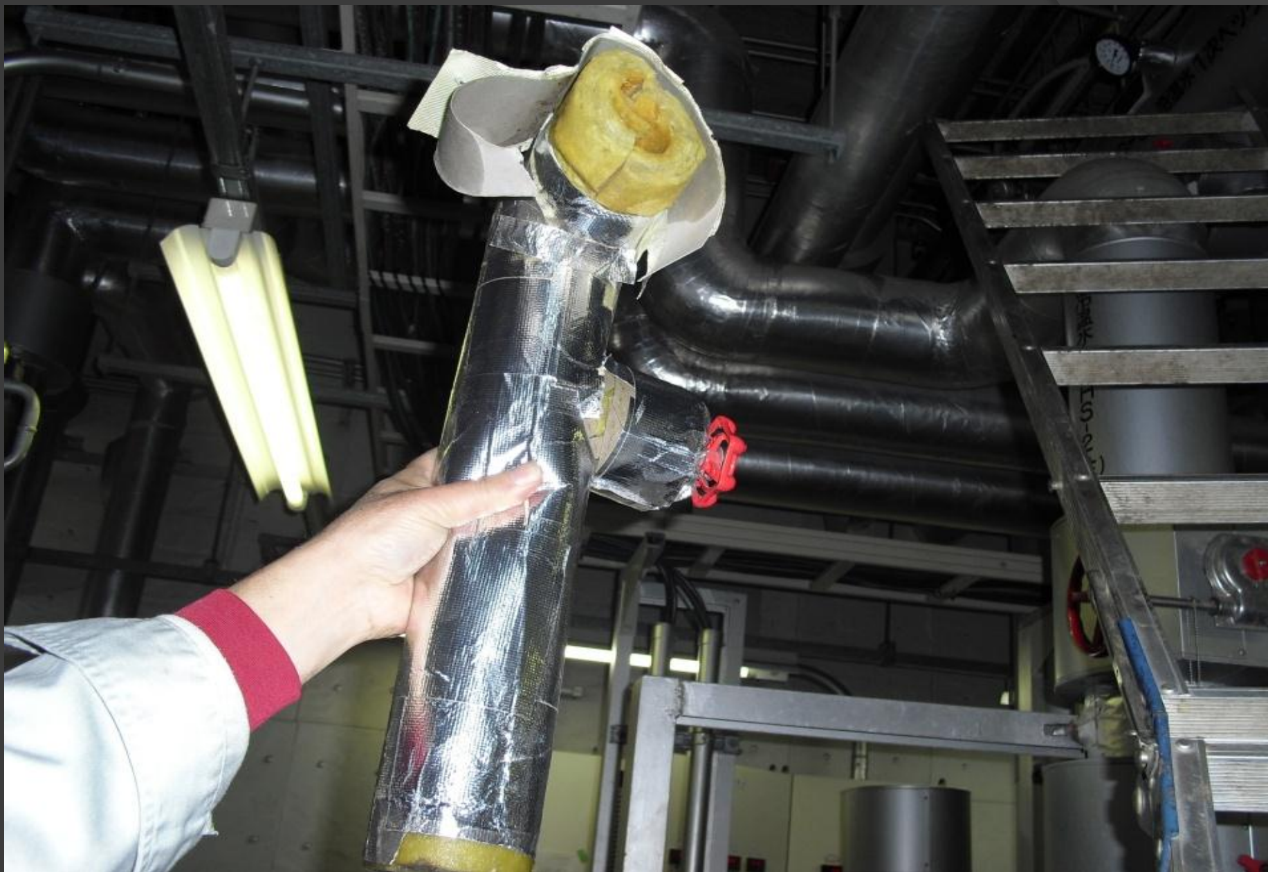
冷温水配管の破断