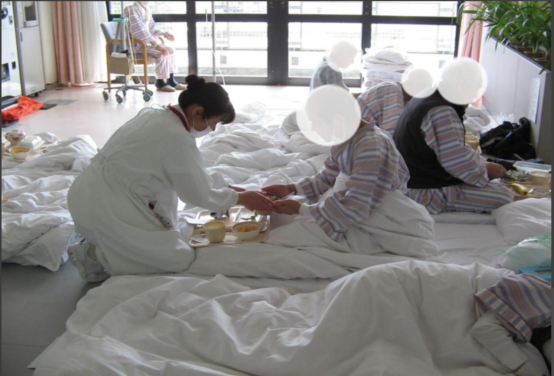
80人の患者を新館へ避難