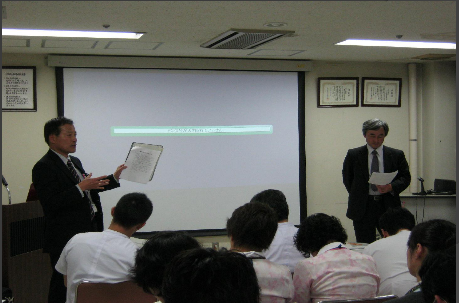
災害拠点病院としての役割をもう一度見直す(4月19日)