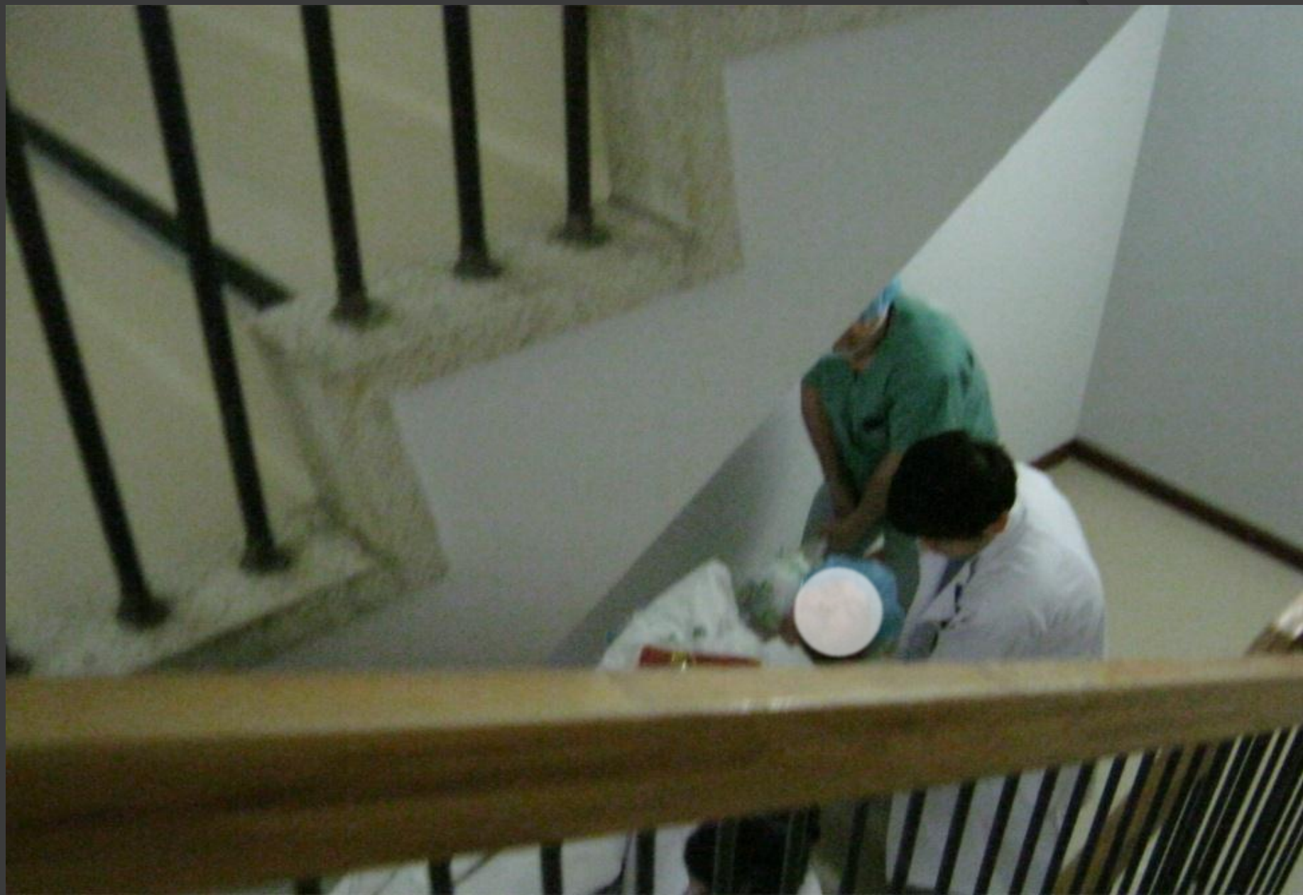
EV停止のため、術後の患者を階段で搬送