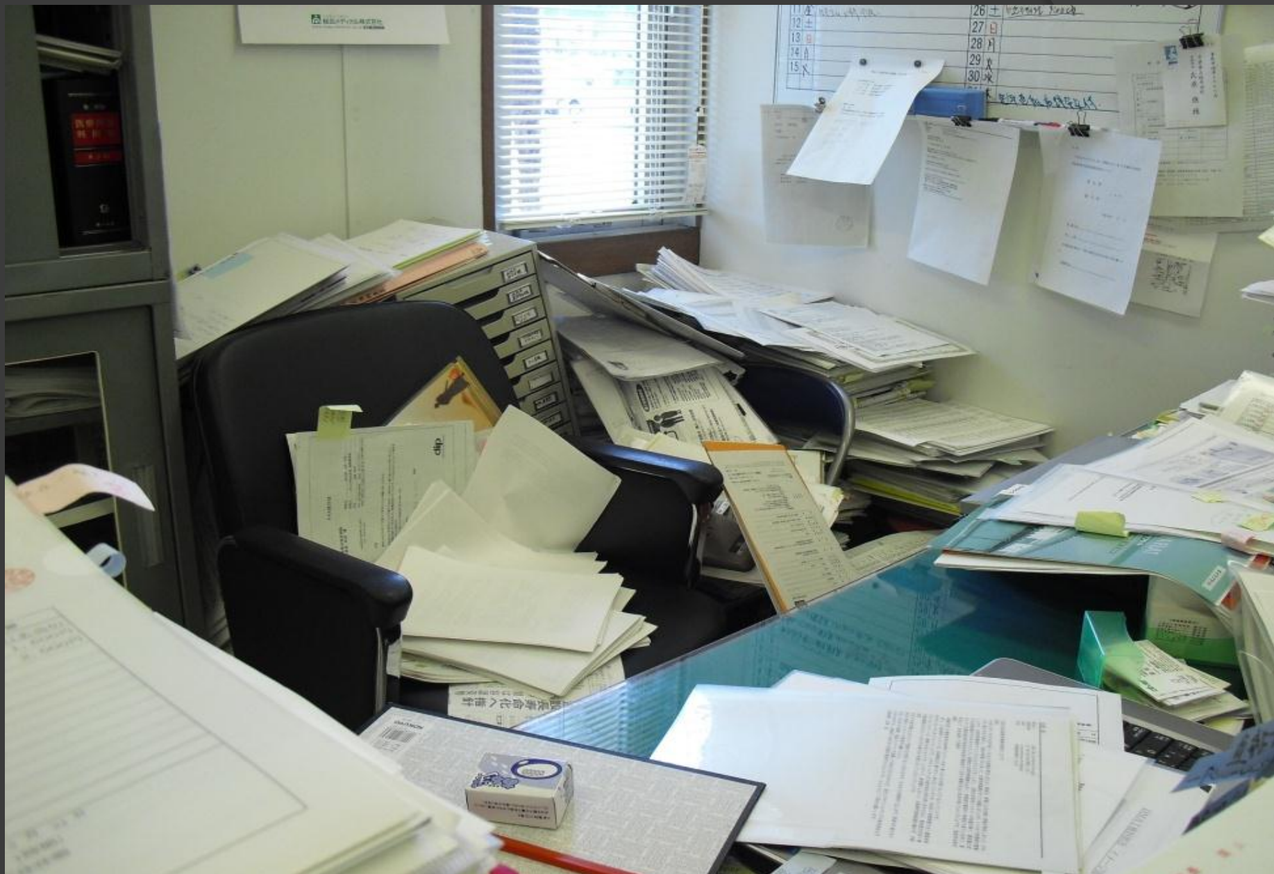
事務局長室の地震直後 ・ 棚の資料が落ちる