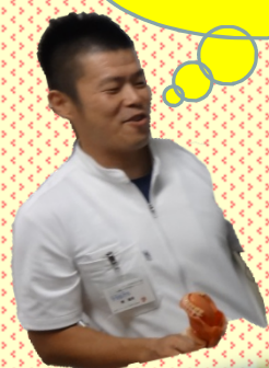
腹腔鏡下手術の体験