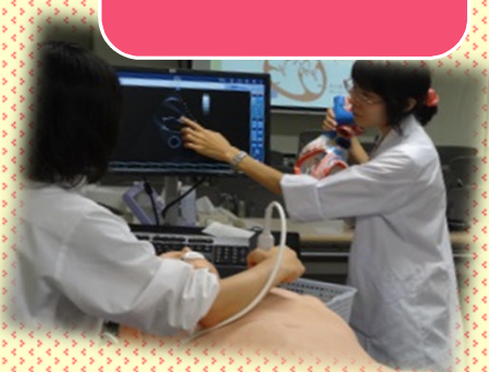
エコーでの心臓検査の体験