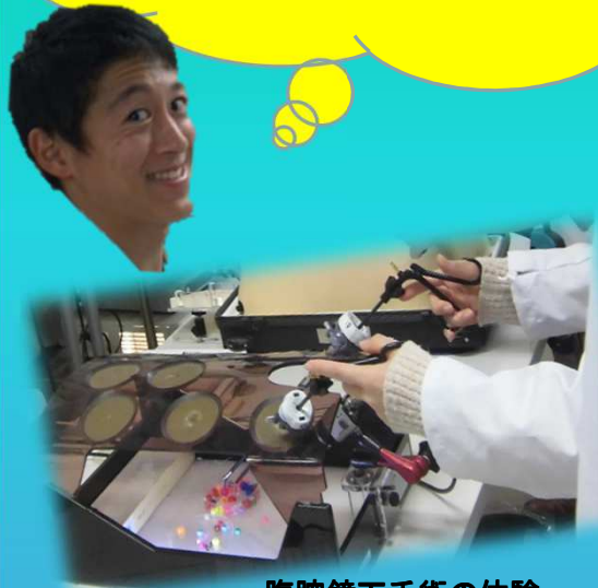
腹腔鏡下手術の体験