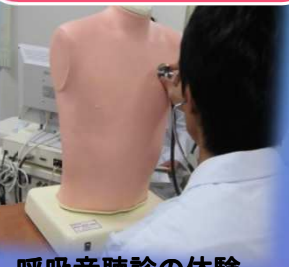
呼吸音聴診の体験