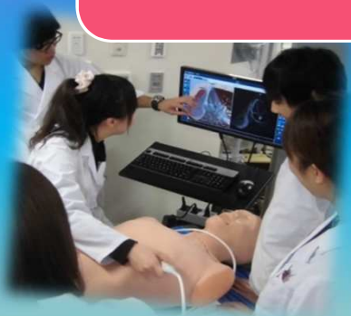
エコーでの心臓検査の体験