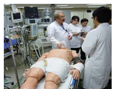
6 シミュレーションセンター