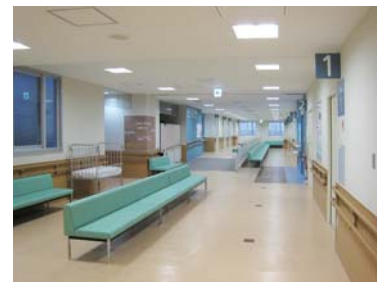
1 外来棟 3F