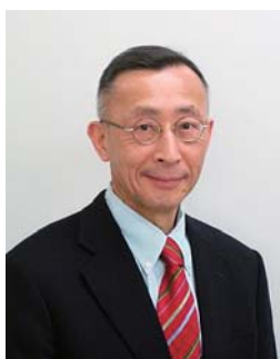
浜松医科大学理事 (財務・病院担当)