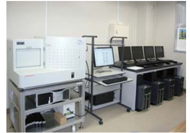
1 病理組織標本等データベース