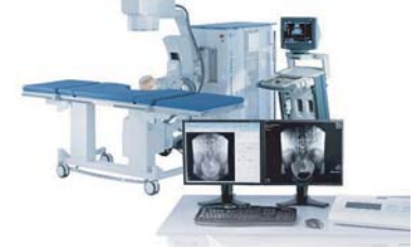
5 体外衝撃波結石破碎システム