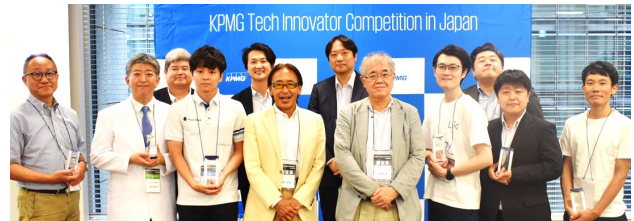
審査員と受賞企業の皆様

厳正なる審査の結果、2023年度の「最優秀賞」には「株式会社Pale Blue」が選定され、日本代表の座を射止めました。